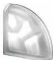
REF.: Q19OCURNOST NORDICA TER CURVO O SAHARA 2S SAP CODE: 123876