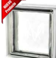
REF.: TC120EICL 1919/13 120F CLEARVIEW SAP CODE: 124539

* Sahara 1 side (sandblasted) available on demand. / Sahara 1 face (sablée) disponible sur demande. / Sahara 1 Seite (sandgestrahlt) auf Anfrage erhältlich. / Sahara 1 lado (satinado a la arena) disponible bajo pedido.