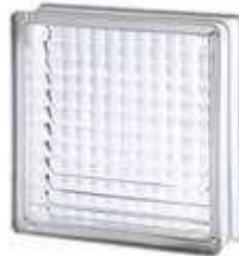
REF.: TC24KG 2424/8 CROSS SMALL SAP CODE: 116 277