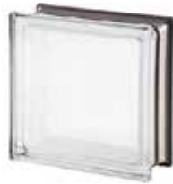
REF.: MNWHT30 WHITE 30% Q19 T MET SAP CODE: 113041