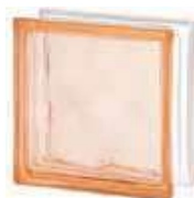
REF.: BSWRS PINK 1919/8 WAVE SAP CODE: 124124