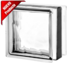
REF.: ESTC19W0.9 1919/13 NUBIO ES 0.9 SAP CODE:124389