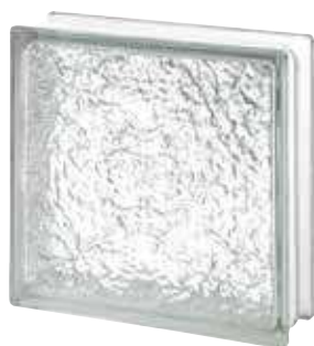
REF.: TC30ICE 3030/10 ICESCAPES SAP CODE: 123205

* Sahara 1 side (sandblasted) available on demand. / Sahara 1 face (sablée) disponible sur demande. / Sahara 1 Seite (sandgestrahlt) auf Anfrage erhältlich. / Sahara 1 lado (satinado a la arena) disponible bajo pedido.