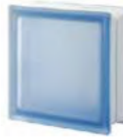
REF.: Q19TBLST BLU Q19 T SAHARA 2S SAP CODE: 124319