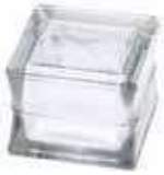
REF.: PSBGCIRC14 BG 1414/11 CIRCLES SAP CODE: 121479