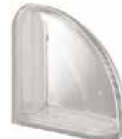
REF.: Q19TCUR NEUTRO TER. CURVO T SAP CODE: 119942