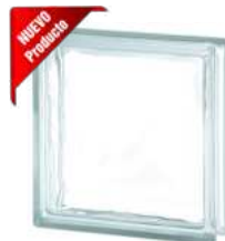
REF.: TC5CL 1919/5 CLEARVIEW SAP CODE: 124490

* Sahara 1 side (sandblasted) available on demand. / Sahara 1 face (sablée) disponible sur demande. / Sahara 1 Seite (sandgestrahlt) auf Anfrage erhältlich. / Sahara 1 lado (satinado a la arena) disponible bajo pedido.