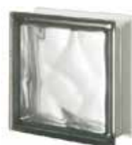
REF.: Q19ONOST1 NORDICA Q19 O SAHARA 1S SAP CODE: 124339