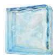
REF.: BSWCURAZ AZUR DOUBLE END 1919/8 WAVE SAP CODE: 116665