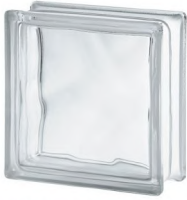
REF.: BSW CLEAR 1919/8 WAVE SAP CODE: 122144