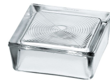
REF.: PSB19 B 1919/7 CIRCLES SAP CODE: 120274