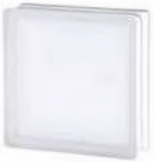
REF.: TC24CLST 2424/8 CLEARVIEW SAHARA 2S* SAP CODE: 118103