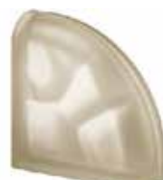
REF.: Q19OCURSIST SIENA TER CURVO O SAHARA 2S SAP CODE: 124094