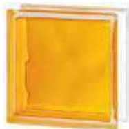
REF.: INAMAR BRILLY YELLOW 1919/8 WAVE SAP CODE: 122192