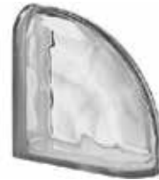
REF.: Q19OCURNO NORDICA TER CURVO O SAP CODE: 122745