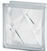
REF.: BSST CLEAR 1919/8 STELLA SAP CODE: 122166