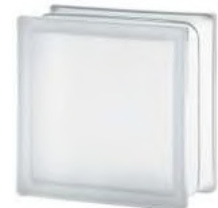
REF.: TC10CLST 1919/10 CLEARVIEW SAHARA 2S* SAP CODE: 112494