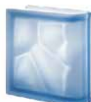
REF.: Q190LINBLST BLU TER LINEARE O SAHARA 2S SAP CODE: 106076