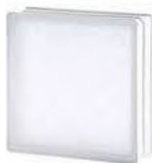
REF.: TC24WST 2424/8 WAVE SAHARA 2S* SAP CODE: 114577