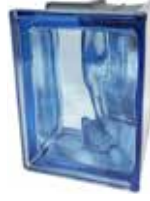
REF.: MT90BL BLU Q19 O MET CORNER 90 SAP CODE: 123799