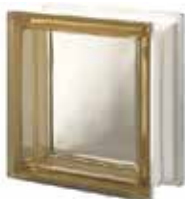
REF.: Q19TSI SIENA Q19 T SAP CODE: 124469