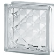
REF.: BSPY CLEAR 1919/8 PYRAMID SAP CODE: 124004