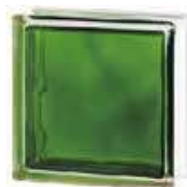
REF.: INVERD BRILLY EMERALD 1919/8 WAVE SAP CODE: 122186