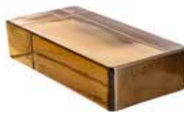
REF.: VPSI SIENA VETROPIENO RETTANGOLARE SAP CODE: 703510