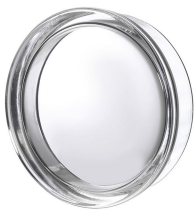
REF.: PSR195 BR19/5 CLEARVIEW SAP CODE: 122240