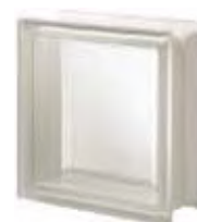
REF.: Q19TST1 NEUTRO Q19 T SAHARA 1S SAP CODE: 124101