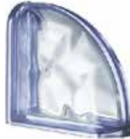
REF.: MTCURBL BLU TER CURVO O MET SAP CODE: 123934