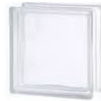
REF.: TCBSH20CL 1919/8 BSH20 CLEARVIEW SAP CODE: 119736