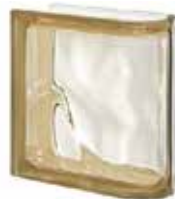
REF.: Q19OLINSI SIENA TER LINEARE O SAP CODE: 123551