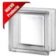
REF.: TC15CL 1515/8 CLEARVIEW SAP CODE: 121417