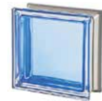
REF.: MNZAFF ZAFFIRO Q19 T MET SAP CODE: 113042

*Verify the availability. / Vérifiez la disponibilité. / Verfügbarkeit und minimale Produktionsmenge. / Verificar la disponibilidad.