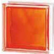
REF.: INNARA BRILLY ORANGE 1919/8 WAVE SAP CODE: 122187