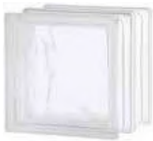
REF.: TCHTIW 1919/16 HTI WAVE SAP CODE: 122975