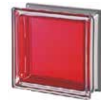
REF.: MNRUBI RUBINO Q19 T MET SAP CODE: 113037