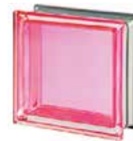
REF.: MNCORA CORALLO Q19 T MET SAP CODE: 113034