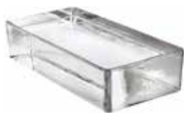
REF.: VPN NEUTRO VETROPIENO RETTANGOLARE SAP CODE: 703410