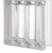
REF.: Q19DRC NEUTRO Q19 DORIC SAP CODE: 121801