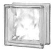
REF.: TC15W 1515/8 WAVE SAP CODE: 121921