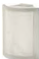
REF.: ANGOST NEUTRO ANG. O SAHARA SAP CODE: 120463