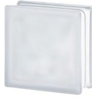
REF.: BSWST CLEAR 1919/8 WAVE SAHARA 2S* SAP CODE: 122161