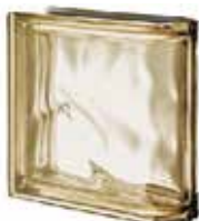
REF.: MTLINSI SIENA TER LINEARE O MET SAP CODE: 123021