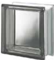
REF.: Q19TNO NORDICA Q19 T SAP CODE: 121380