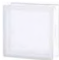
REF.: TCBSH20CLST 1919/8 BSH20 CLEARVIEW SAHARA 2S* SAP CODE: 113882