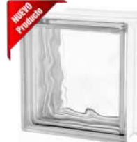
REF.: TC60EIW 1919/16 60F WAVE SAP CODE: 123771