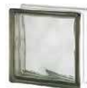
REF.: BSWGR GREY 1919/8 WAVE SAP CODE: 122172