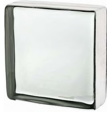
REF.: VB883 CLEAR 883 VISTABRIK* SAP CODE: 124366