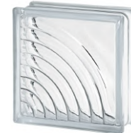
REF.: BSMI CLEAR 1919/8 MIDARC SAP CODE: 122153