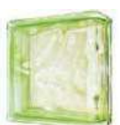
REF.: BSWLINVE GREEN LINEAR END 1919/8 WAVE SAP CODE: 116662