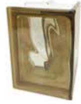
REF.: Q19090SI SIENA Q19 O CORNER 90* SAP CODE: 123926