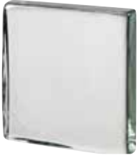
REF.: VB881 CLEAR 881.5 VISTABRIK* SAP CODE: 123073