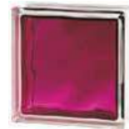
REF.: INRUBI BRILLY RUBY 1919/8 WAVE SAP CODE: 122189