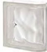
REF.: Q19OLIN NEUTRO TER. LINEARE O SAP CODE: 119901