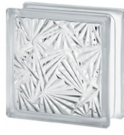
REF.: BSCU CLEAR 1919/8 CUNEIS SAP CODE: 122138