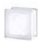
REF.: TC11CLST 1111/8 CLEARVIEW SAHARA 2S* SAP CODE: 115148