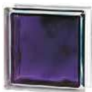
REF.: INVIOLO BRILLY VIOLET 1919/8 WAVE SAP CODE: 122191