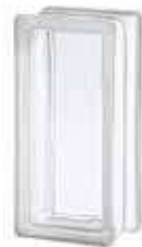
REF.: TC2411CL 2411/8 CLEARVIEW SAP CODE: 114209