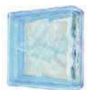
REF.: BSWLINAZ AZUR LINEAR END 1919/8 WAVE SAP CODE: 116661