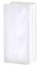
REF.: TC2411WST 2411/8 WAVE SAHARA 2S* SAP CODE: 114506