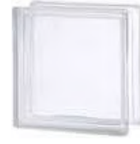
REF.: TC30EICL 1919/8 30F CLEARVIEW SAP CODE: 122946