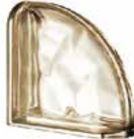
REF.: MTCURSI SIENA TER CURVO O MET SAP CODE: 123797