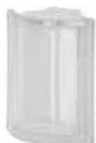
REF.: ANGT NEUTRO ANG. T SAP CODE: 120430