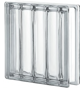
REF.: Q30DRC NEUTRO Q30 DORIC SAP CODE: 122141