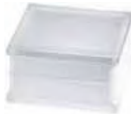
REF.: PSBG10CLST BG 1919/10 CLEARVIEW SAHARA 2S* SAP CODE: 121546

* Sahara 1 side (sandblasted) available on demand. / Sahara 1 face (sablée) disponible sur demande. / Sahara 1 Seite (sandgestrahlt) auf Anfrage erhältlich. / Sahara 1 lado (satinado a la arena) disponible bajo pedido.