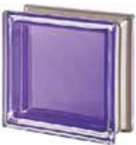
REF.: MNAMET AMETISTA Q19 T MET SAP CODE: 113029