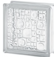
REF.: BSSP CLEAR 1919/8 SPONGE SAP CODE: 122165