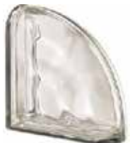
REF.: MTCUR NEUTRO TER. CURVO O MET SAP CODE: 119975