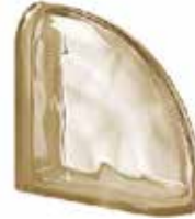
REF.: Q19OCURSI SIENA TER CURVO O SAP CODE: 123835