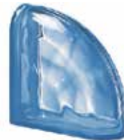
REF.: Q190CURBL BLU TER CURVO O SAP CODE: 122744