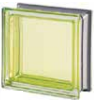
REF.: MNBERI BERILLO Q19 T MET SAP CODE: 113030