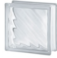
REF.: BSDI CLEAR 1919/8 DIGONA SAP CODE: 122148