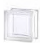
REF.: TC11CL 1111/8 CLEARVIEW SAP CODE: 115146