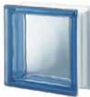
REF.: Q19TBL BLU Q19 T SAP CODE: 122075