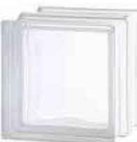
REF.: TC90EICL 1919/16 90F CLEARVIEW SAP CODE: 122956