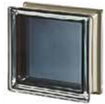
REF.: MNBLK30 BLACK 30% Q19 T MET SAP CODE: 113032