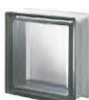
REF.: Q19TNOST1 NORDICA Q19 T SAHARA 1S SAP CODE: 121534