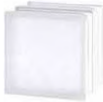
REF.: TCHTIWST 1919/16 HTI WAVE SAHARA 2S* SAP CODE: 122977