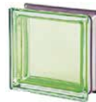
REF.: MNMALA MALACHITE Q19 T MET SAP CODE: 113036