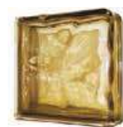
REF.: BSWCURBR BROWN DOUBLE END 1919/8 WAVE SAP CODE: 116667