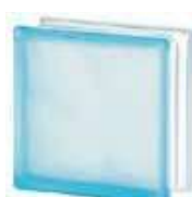
REF.: BSWAZST AZUR 1919/8 WAVE SAHARA 2S* SAP CODE: 122177