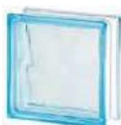
REF.: BSWAZ AZUR 1919/8 WAVE SAP CODE: 122169