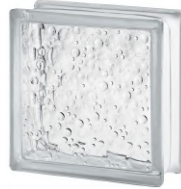
REF.: BSSV CLEAR 1919/8 SAVONA SAP CODE: 122164