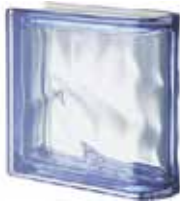
REF.: MTLINBL BLU TER LINEARE O MET SAP CODE: 123491