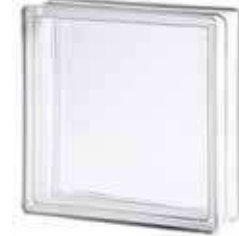
REF.: TC24CL 2424/8 CLEARVIEW SAP CODE: 114095