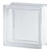
REF.: TC10CL 1919/10 CLEARVIEW SAP CODE: 112283