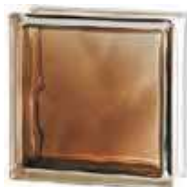
REF.: INBRON BRILLY BRONZE 1919/8 WAVE SAP CODE: 122185