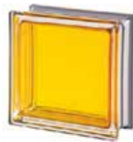
REF.: MNTOPA TOPAZIO Q19 T MET SAP CODE: 113038