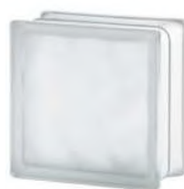
REF.: TC10WST 1919/10 WAVE SAHARA 2S* SAP CODE: 112492