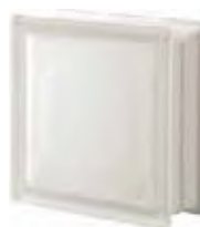
REF.: Q19TST NEUTRO Q19 T SAHARA 2S SAP CODE: 123971