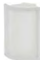
REF.: ANGST NEUTRO ANG. T SAHARA SAP CODE: 123721