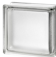
REF.: BSARLIN CLEAR 19/8 LINEAR END ARCTIC SAP CODE: 123242