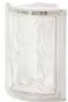
REF.: ANGO NEUTRO ANG. O SAP CODE: 120429