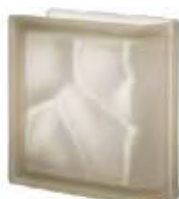
REF.: Q19OLINSIST SIENA TER LINEARE O SAHARA 2S SAP CODE: 124093