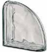
REF.: MTCURNO NORDICA TER CURVO O MET SAP CODE: 123794