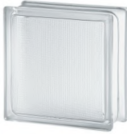
REF.: BSSA CLEAR 1919/8 SAMBA SAP CODE: 122137