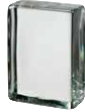
REF.: VB683 CLEAR 683 VISTABRIK SAP CODE: 123105