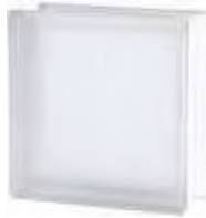
REF.: TCBSH20WST 1919/8 BSH20 WAVE SAHARA 2S* SAP CODE: 113883