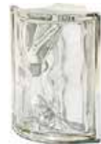
REF.: MTANG NEUTRO ANG. O MET SAP CODE: 120461