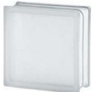
REF.: BSCLST CLEAR 1919/8 CLEARVIEW SAHARA 2S* SAP CODE: 122168