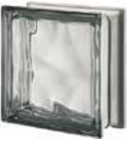
REF.: MTQ19ONO NORDICA Q19 O MET SAP CODE: 115358