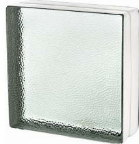
REF.: VB883S CLEAR 883 VISTABRIK STIPPLED SAP CODE: 124477

*Verify the availability. / Verificar la disponibilidad.