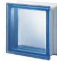
REF.: Q19TBLST1 BLU Q19 T SAHARA 1S SAP CODE: 124040