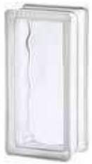
REF.: TC2411W 2411/8 WAVE SAP CODE: 114208