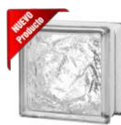
REF.: TC15IC 1515/8 ICY SAP CODE: 121914