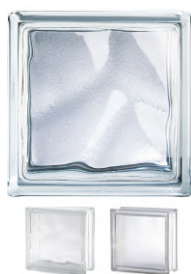
REF.: BSWAR CLEAR 1919/8 FROZEN 2 CARAS W+AR SAP CODE: 124190