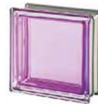
REF.: MNTORM TORMALINA Q19 T MET SAP CODE: 113039