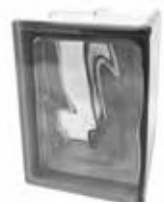
REF.: Q19O90NO NORDICA Q19 O CORNER 90°* SAP CODE: 123927