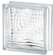
REF.: BSOP CLEAR 1919/8 OPTICAL SAP CODE: 122154