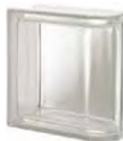
REF.: Q19TLIN NEUTRO TER. LINEARE T SAP CODE: 119902