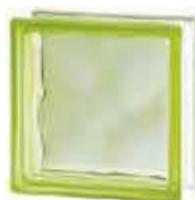
REF.: BSWVE GREEN 1919/8 WAVE SAP CODE: 122140