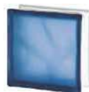
REF.: BSWCOST BLUE 1919/8 WAVE SAHARA 2S* SAP CODE: 122178