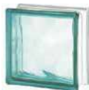
REF.: BSWTU TURQUOISE 1919/8 WAVE SAP CODE: 122174