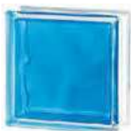
REF.: INAZUL BRILLY BLUE 1919/8 WAVE SAP CODE: 122184