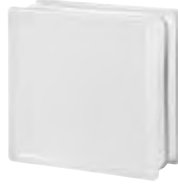
REF.: OP884PL OPAL 884 PLAIN SAP CODE: 704685