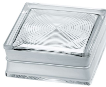
REF.: PSBGCIRC19 BG 1919/8 CIRCLES* SAP CODE: 114776