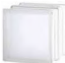
REF.: TC90EICLST 1919/16 90F CLEARVIEW SAHARA 2S* SAP CODE: 122955