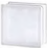
REF.: TCShSWST 1919/10 30F WAVE SAHARA 2S* SAP CODE: 118213