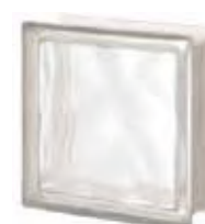
REF.: Q19OLINST1 NEUTRO Q19 O SAHARA 1S SAP CODE: 123762