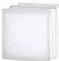
REF.: TC60EICLST 1919/16 60F CLEARVIEW SAHARA 2S* SAP CODE: 122949