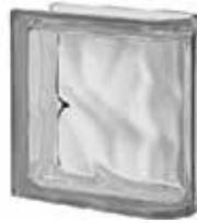
REF.: Q19OLINNO NORDICA TER LINEARE O SAP CODE: 124313