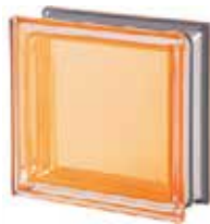
REF.: MNAMBR AMBRA Q19 T MET SAP CODE: 113028