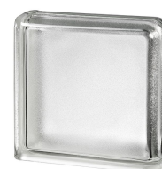
REF.: BSARCUR CLEAR 19/8 DOUBLE END ARCTIC SAP CODE: 123243