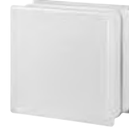
REF.: OP884SL OPAL 884 SILK SAP CODE: 704686