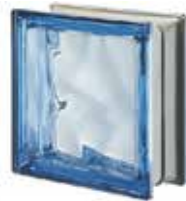
REF.: MTQ190BL BLU Q19 O MET SAP CODE: 122422