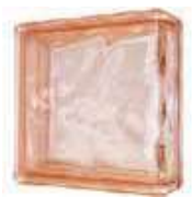
REF.: BSWLINRS PINK LINEAR END 1919/8 WAVE SAP CODE: 124183

*Sahara 1 side (sandblasted) available on demand; minimum order 360 pcs. / Sahara 1 face (sablée) disponible sur demande; commande minimum 360 pièces. / Sahara 1 Seite (sandgestrahlt) auf Anfrage erhältlich; Mindestbestellmenge 360 Stk. / Sahara 1 lado (satinado a la arena) disponible bajo pedido; pedido mínimo de 360 piezas.