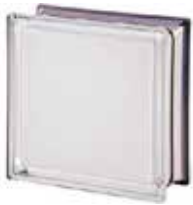
REF.: MNWHT100 WHITE 100% Q19 T MET SAP CODE: 113040