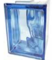
REF.: Q19090BL BLU Q19 O CORNER 90° SAP CODE: 123923