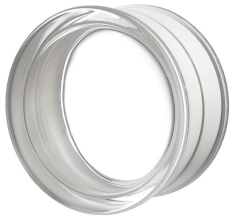
REF.: PSR1910 BGR19/10 CLEARVIEW SAP CODE: 122239