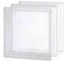
REF.: TCHTICL 1919/16 HTI CLEARVIEW SAP CODE: 122972