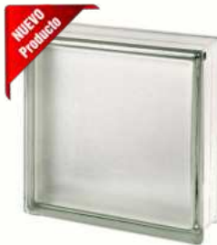
REF.: TC24AR 2424/8 ARCTIC SAP CODE: 124483