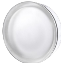
REF.: PSR195ST1 BR19/5 CLEARVIEW SAHARA 1S SAP CODE: 122245