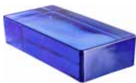
REF.: VPBL BLU VETROPIENO RETTANGOLARE SAP CODE: 704170