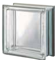
REF.: MTQ19T NEUTRO Q19 T MET SAP CODE: 120300