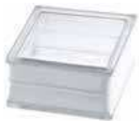
REF.: PSBG10CL BG 1919/10 CLEARVIEW SAP CODE: 121391