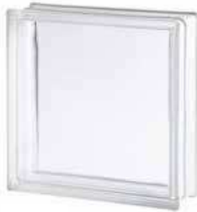
REF.: TC30CL 3030/10 CLEARVIEW SAP CODE: 118771