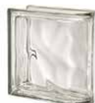
REF.: MTLIN NEUTRO TER. LINEARE O MET SAP CODE: 119964