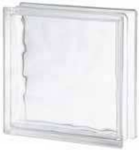
REF.: TC30W 3030/10 WAVE SAP CODE: 117890