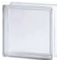
REF.: TCBSH20OR 1919/8 BSH20 ORSA SAP CODE: 119734

* Sahara 1 side (sandblasted) available on demand. / Sahara 1 face (sablée) disponible sur demande. / Sahara 1 Seite (sandgestrahlt) auf Anfrage erhältlich. / Sahara 1 lado (satinado a la arena) disponible bajo pedido.