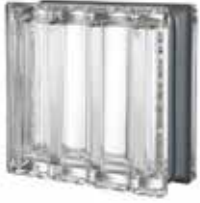
REF.: Q19DRCMT NEUTRO Q19 DORIC MET SAP CODE: 121934