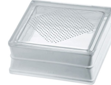
REF.: PSBGDOT BG 1919/8 DOTS* SAP CODE: 114933