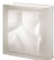
REF.: Q19OLINST NEUTRO TER. LINEARE O SAHARA 2S SAP CODE: 120105