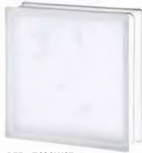
REF.: TC30WST 3030/10 WAVE SAHARA 2S* SAP CODE: 118411