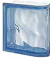
REF.: Q190LINBL BLU TER LINEARE O SAP CODE: 123623