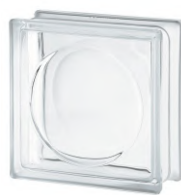
REF.: BSAL CLEAR 1919/8 ALPHA SAP CODE: 122147