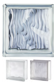
REF.: BSWOP CLEAR 1919/8 STORTY 2 CARAS W+OP SAP CODE: 124231

* Sahara 1 side [sandblasted] available on demand. / Sahara 1 face [sablée] disponible sur demande. / Sahara 1 Seite [sandgestrahlt] auf Anfrage erhältlich. / Sahara 1 lado [satinado a la arena] disponible bajo pedido.