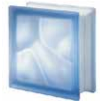
REF.: Q190BLST BLU Q19 O SAHARA 2S SAP CODE: 124189