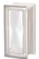
REF.: R09OLINST1 NEUTRO R09 O SAHARA 1S SAP CODE: 123724