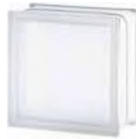
REF.: TCShSCLST 1919/10 30F CLEARVIEW SAHARA 2S* SAP CODE: 111544