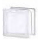
REF.: TC11WST 1111/8 WAVE SAHARA 2S* SAP CODE: 115151