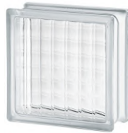
REF.: BSXL CLEAR 1919/8 CROSS LARGE SAP CODE: 122136