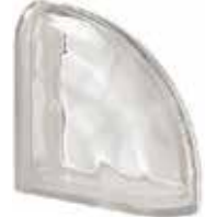
REF.: Q19OCUR NEUTRO TER. CURVO O SAP CODE: 119943