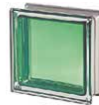
REF.: MNGIAD GIADA Q19 T MET SAP CODE: 113035