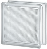
REF.: TCDIR 1919/8 LIGHT DIRECTING SAP CODE: 112978