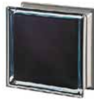
REF.: MNBLK100 BLACK 100% Q19 T MET SAP CODE: 113031