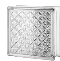
REF.: BSAK CLEAR 1919/8 AKTIS SAP CODE: 124193