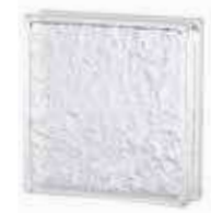
REF.: TC5COR 1919/5 CORTINA SAP CODE: 119797