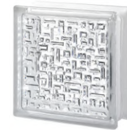
REF.: BSMY CLEAR 1919/8 MAYA SAP CODE: 124354