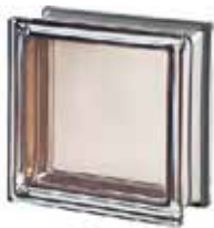
REF.: MNAGAT AGATA Q19 T MET SAP CODE: 113027