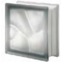
REF.: Q19ONOST NORDICA Q19 O SAT SAP CODE: 120942