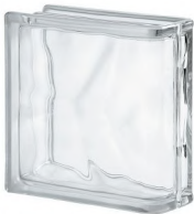
REF.: BSWLIN CLEAR 1919/8 LINEAR END WAVE SAP CODE: 122151