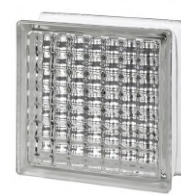
REF.: BSSO CLEAR 1919/8 SONA SAP CODE: 124073