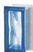
REF.: R090BLST1 BLU R09 O SAHARA 1S SAP CODE: 122502