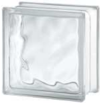
REF.: TC10W 1919/10 WAVE SAP CODE: 118093