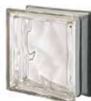
REF.: MTQ190 NEUTRO Q19 O MET SAP CODE: 119961