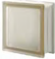
REF.: Q19TSIST SIENA Q19 T SAHARA 2S SAP CODE: 124473