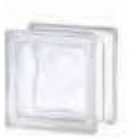
REF.: TC11W 1111/8 WAVE SAP CODE: 115144