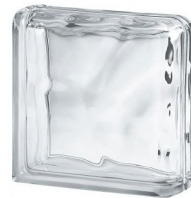
REF.: BSWCUR CLEAR 1919/8 DOUBLE END WAVE SAP CODE: 122149