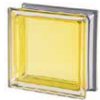
REF.: MNCITR CITRINO Q19 T MET SAP CODE: 113033