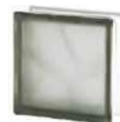
REF.: BSWGRST GREY 1919/8 WAVE SAHARA 2S* SAP CODE: 122181