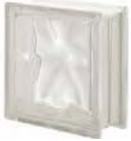
REF.: Q190 NEUTRO Q19 O SAP CODE: 119821