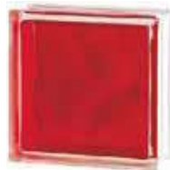
REF.: INROJO BRILLY RED 1919/8 WAVE SAP CODE: 122188