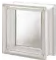
REF.: Q19T NEUTRO Q19 T SAP CODE: 119822