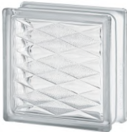
REF.: BSLO CLEAR 1919/8 LOZENGE SAP CODE: 122142