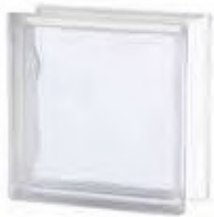
REF.: TCBSH20W 1919/8 BSH20 WAVE SAP CODE: 119735