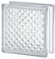
REF.: BSIN CLEAR 1919/8 INCA SAP CODE: 124166