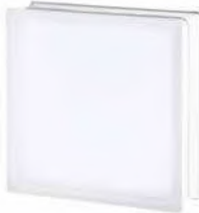
REF.: TC30CLST 3030/10 CLEARVIEW SAHARA 2S* SAP CODE: 120081