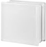
REF.: OPPL OPAL 1919/8 PLAIN SAP CODE: 704687

Available while stocks last. / Disponibles hasta agotar existencias.