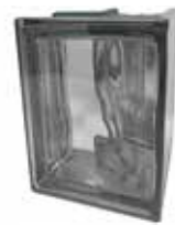
REF.: MT90NO NORDICA Q19 O MET CORNER 90° SAP CODE: 123800