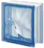
REF.: Q190BL BLU Q19 O SAP CODE: 122074