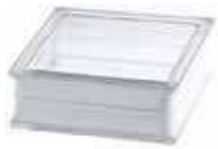
REF.: PSBGCL BG 1919/8 CLEARVIEW SAP CODE: 115504