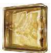
REF.: BSWLINBR BROWN LINEAR END 1919/8 WAVE SAP CODE: 116663