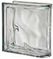
REF.: MTLINNO NORDICA TER LINEARE O MET SAP CODE: 124330