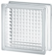
REF.: BSXS CLEAR 1919/8 CROSS SMALL SAP CODE: 118074