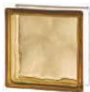
REF.: BSWBR BROWN 1919/8 WAVE SAP CODE: 122171