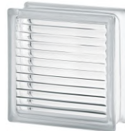
REF.: BSPA CLEAR 1919/8 PARALLINE SAP CODE: 122155