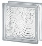
REF.: BSMA CLEAR 1919/8 MARINA SAP CODE: 123997