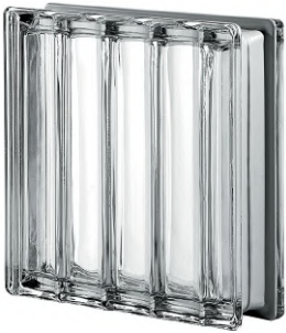
REF.: Q30DRCMT NEUTRO Q30 DORIC MET SAP CODE: 123017