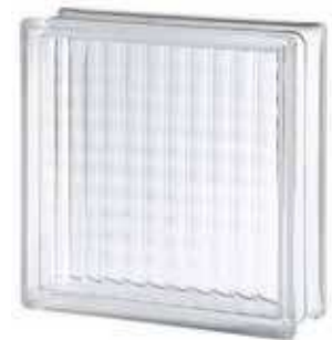
REF.: TC30BKG 3030/10 CROSS LARGE SAP CODE: 114779