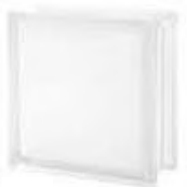
REF.: INBLAN MATTY WHITE 1919/8 CLEARVIEW SAP CODE: 122195