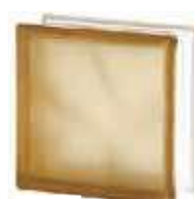
REF.: BSWBRST BROWN 1919/8 WAVE SAHARA 2S* SAP CODE: 122179