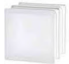
REF.: TCHTICLST 1919/16 HTI CLEARVIEW SAHARA 2S* SAP CODE: 122974

* Sahara 1 side (sandblasted) available on demand. / Sahara 1 face (sablée) disponible sur demande. / Sahara 1 Seite (sandgestrahlt) auf Anfrage erhältlich. / Sahara 1 lado (satinado a la arena) disponible bajo pedido.