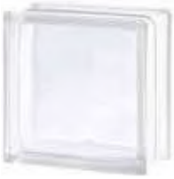
REF.: TCShSW 1919/10 30F WAVE SAP CODE: 111543