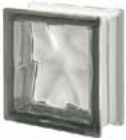
REF.: Q19ONO NORDICA Q19 O SAP CODE: 120762