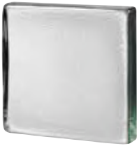
REF.: VB881S CLEAR 881.5 VISTABRIK STIPPLED* SAP CODE: 123104