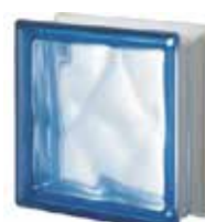
REF.: Q190BLST1 BLU Q19 O SAHARA 1S SAP CODE: 124136