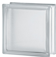
REF.: BSAR CLEAR 1919/8 ARCTIC SAP CODE: 122134