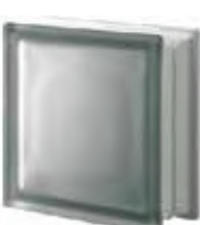
REF.: Q19TNOST NORDICA Q19 T SAHARA 2S SAP CODE: 121194