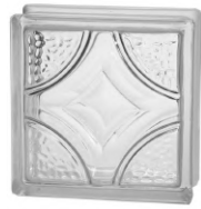
REF.: BSDE CLEAR 1919/8 DECO SAP CODE: 122139