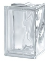
REF.: BSW90 CLEAR 1919/8 CORNER 90 WAVE** SAP CODE: 111332