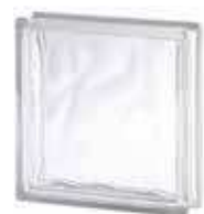
REF.: TC5W 1919/5 WAVE SAP CODE: 115336