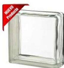
REF.: BSCLCUR CLEAR 1919/8 DOUBLE END CLEARVIEW SAP CODE: 124502