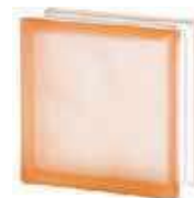
REF.: BSWRSST PINK 1919/8 WAVE SAHARA 2S* SAP CODE: 124152