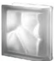
REF.: Q19OLINNOST NORDICA TER LINEARE O SAHARA 2S SAP CODE: 124370