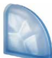
REF.: Q190CURBLST BLU TER CURVO O SAHARA 2S SAP CODE: 123783