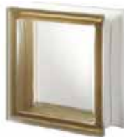
REF.: Q19TSIST1 SIENA Q19 T SAHARA 1S SAP CODE: 122601

* Sahara (sandblasted) available on demand / Sahara (sablée) disponible sur demande / Sahara (sandgestrahlt) auf Anfrage erhältlich / Sahara (satinado a la arena) disponible bajo pedido.