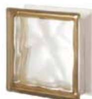
REF.: Q19OSIST1 SIENA Q19 O SAHARA 1S SAP CODE: 121621