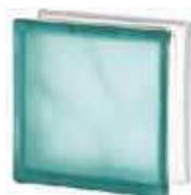
REF.: BSWTUST TURQUOISE 1919/8 WAVE SAHARA 2S* SAP CODE: 122183