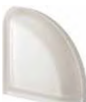
REF.: Q19TCURST NEUTRO TER. CURVO T SAHARA 2S SAP CODE: 120249