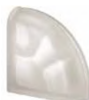
REF.: Q19OCURST NEUTRO TER. CURVO O SAHARA 2S SAP CODE: 120248