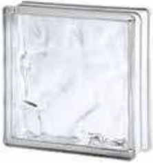
REF.: TC24W 2424/8 WAVE SAP CODE: 114094