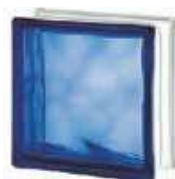
REF.: BSWCO BLUE 1919/8 WAVE SAP CODE: 122170