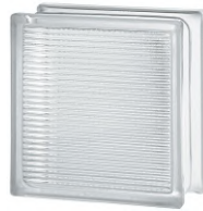
REF.: TCDIF 1919/8 LIGHT DIFFUSING SAP CODE: 112977