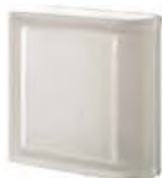
REF.: Q19TLINST NEUTRO TER. LINEARE T SAHARA 2S SAP CODE: 123943