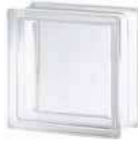
REF.: TCShSCL 1919/10 30F CLEARVIEW SAP CODE: 111542