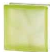
REF.: BSWVEST GREEN 1919/8 WAVE SAHARA 2S* SAP CODE: 122180