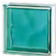
REF.: INTURQ BRILLY TURQUOISE 1919/8 WAVE SAP CODE: 122190