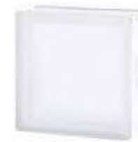
REF.: TC30EICLST 1919/8 30F CLEARVIEW SAHARA 2S* SAP CODE: 122944