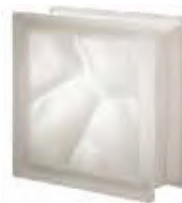
REF.: Q190ST NEUTRO Q19 O SAHARA SAP CODE: 123951