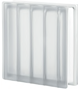
REF.: Q30DRCST NEUTRO Q30 DORIC SAHARA 2S SAP CODE: 122392