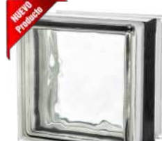
REF.: TC120EIW 1919/13 120F WAVE SAP CODE: 124251