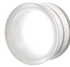
REF.: PSR1910ST1 BGR19/10 CLEARVIEW SAHARA 1S SAP CODE: 122243