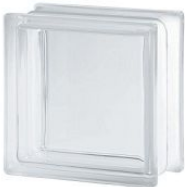
REF.: BSCL CLEAR 1919/8 CLEARVIEW SAP CODE: 122135