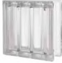
REF.: Q19DRCST1 NEUTRO Q19 DORIC SAHARA 1S SAP CODE: 121932