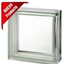
REF.: BSCLLIN CLEAR 1919/8 LINEAR END CLEARVIEW SAP CODE: 124463