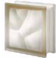
REF.: Q19OSIST SIENA Q19 O SAHARA 2S SAP CODE: 123584