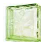
REF.: BSWCURVE GREEN DOUBLE END 1919/8 WAVE SAP CODE: 116666